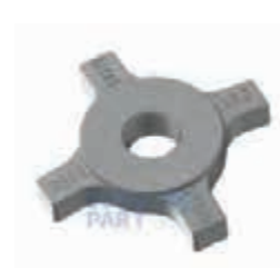
ФИТИНГ-ГАЙКА стопорная 38 S 140X140X25