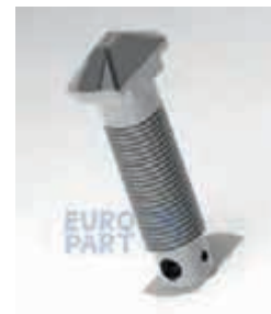
ФИТИНГ-БОЛТ 52 S 98X54X225