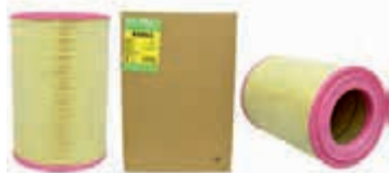
ФИЛЬТР ВОЗДУШНЫЙ Volvo FL II, FE II, RVI Magnum