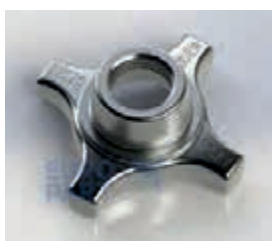
ФИТИНГ-ГАЙКА стопорная 52 S 170X170X65