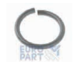
КОЛЬЦО СТОПОРНОЕ 38 S