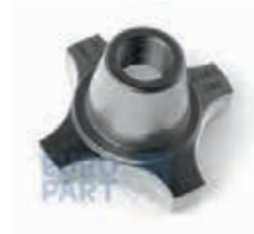
ФИТИНГ-ГАЙКА стопорная 38 S