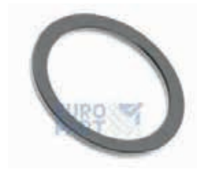
КОЛЬЦО ФИТИНГА 52 S