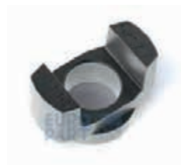
ВТУЛКА НАПРАВЛЯЮЩАЯ фитинга D 38