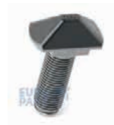
ФИТИНГ-БОЛТ 38 S