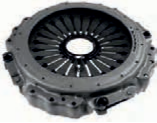
ДИСК СЦЕПЛЕНИЯ нажимной 430 мм