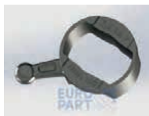
ВТУЛКА СТОПОРА наружная