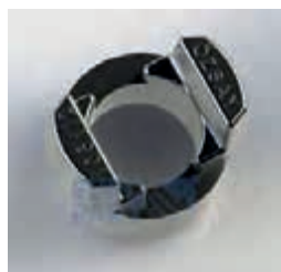
ВТУЛКА замкового механизма 52 S