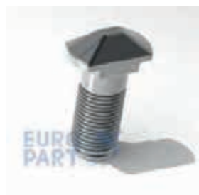
ФИТИНГ-БОЛТ 52 S 98X54X155