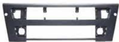
РЕШЕТКА РАДИАТОРА VOLVO FM Vers.3 нижняя