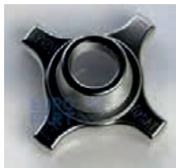
ФИТИНГ-ГАЙКА стопорная 52 S