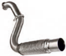
ПЕРЕДНЯЯ ТРУБА с гофрой (нерж)